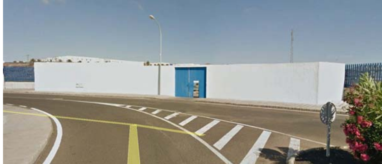
▲ Fotografía del exterior del almacén.

Se ubica en una parcela de 458,23m 2 de superficie total, de los cuales 112,32m 2 de superficie esta destinados a establecimiento industrial con uso almacén en cubierto y 345,91m 2 de superficie están destinados a espacio abierto con uso almacén en descubierto.