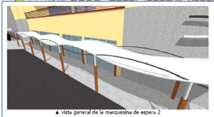
▲ vista general de la marquesina de espera 2