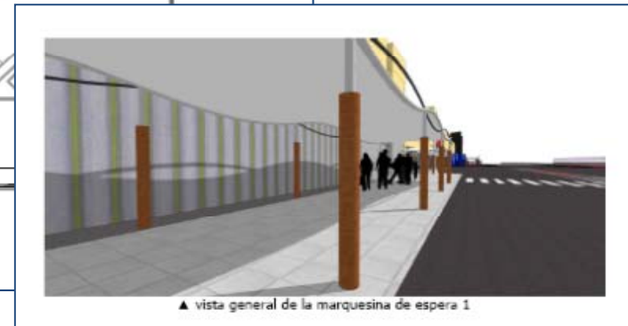
▲ vista general de la marquesina de espera 1