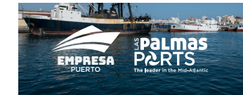
Marca conjunta monocromo